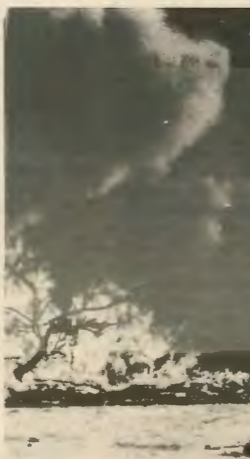
Απο τις κινητοποιήσεις στη Χίλη 100 πληγωμένοι — 26 νεκροί

σκόζιζον από διασπάσεις. Το γεγονός ότι δεν χρησιμοποιήσαν αυτές τις ευνοϊκές συνθήκες για την εξουσία παραδέχτηκε ο ηγέτης του E.R.P. έδωσε την ευκαιρία στο στρατό να επιβάλει την τρομοκρατία στις πόλεις και στην ύπαιθρο όπου είχαν υποστηρίξει οι αντάρτες, σπρώχνοντας έτσι το κίνημα προς τα πίσω και κινδυνεύοντας τις επαναστατικές δυνάμεις.